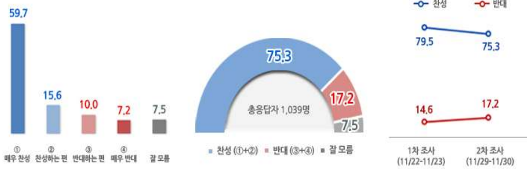
차대통령 탄핵에 대한 국민여론 단위:%

문1. 국회는 오는 12월 2일, 늦어도 9일까지 정기국회 본회의에서 박근혜 대통령에 대한 탄핵안을 처리할 것으로 알려지고 있습니다. 선생님께서는 박 대통령을 탄핵하는 것에 대해 어떻게 생각하십니까?